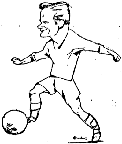
(il mediano destro Fido)

È l'unico responsabile, con l'avallo del segnalinee «o ciaccato» del gran finale giallo di Piazza d'Armi. La semplice cronaca dell'incontro autorizza a pensare che questo «signore» sia sceso in campo non per arbitrare ma per «sfottare» e provocare lo sportivissimo pubblico irpino. Pro-