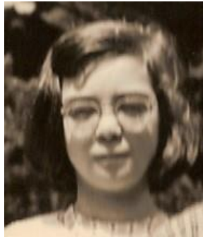
... e Marinella...