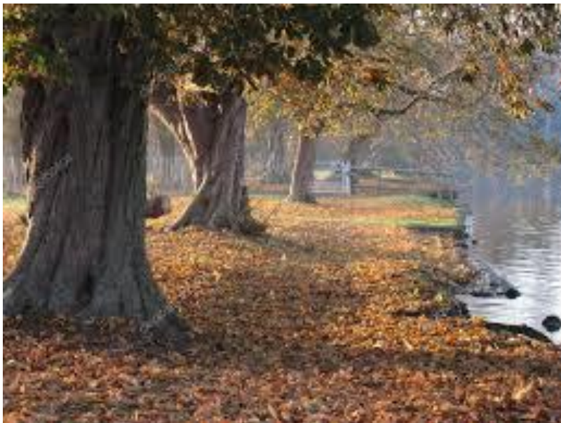
Il bosco dei ciclamini e la sponda del Rio Cupo

<<...Uh... è un ciclamino! >>, fu il grido di sorpresa e felicità di quei due ragazzini che cercavano nel boschetto castagne e frutti autunnali ma che erano rimasti esterrefatti dalla bellezza di quel fiore, dal colore rosa splendido, nascosto tra le infinite specie di erbe ed arbusti in quella selva fin lì incontaminata.