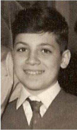
... con Leonardo