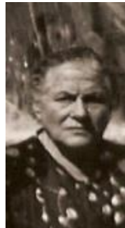
... o con... Zia Sara ... e...