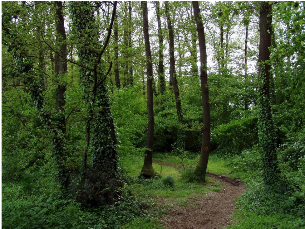
Il romantico sentiero nel bosco dei castagni

cavallerescamente la propria vigorosa mano di sostegno, come un discendente dei cavalieri Normanni e Longobardi, quelli delle Giostre medievali e della famosa “chanson de Roland”, che avevano percorso queste contrade alcuni secoli prima. E ne riceveva in cambio un silenzioso e gentile sorriso di gratitudine.