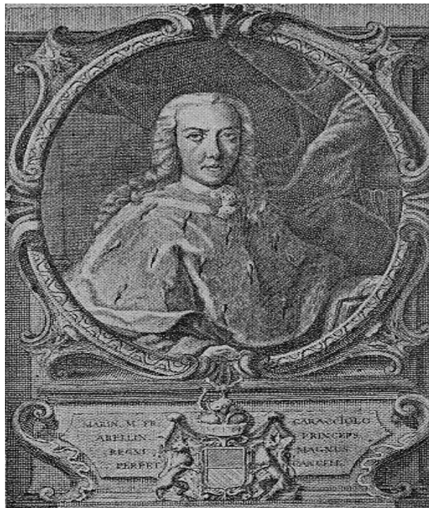
Il principe Marino III Francesco Maria

centro economico in quanto l'espansione della città era sempre più diretta verso Napoli.