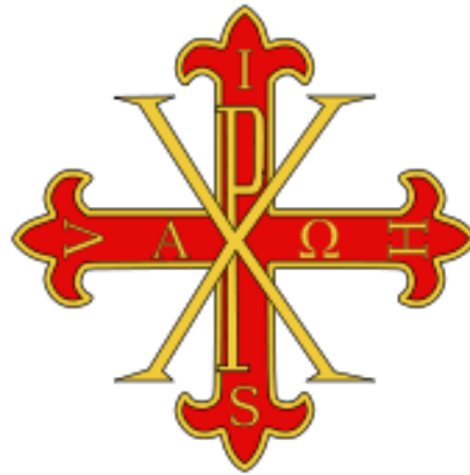
Insegne dell'Ordine Costantiniano di S. Giorgio.