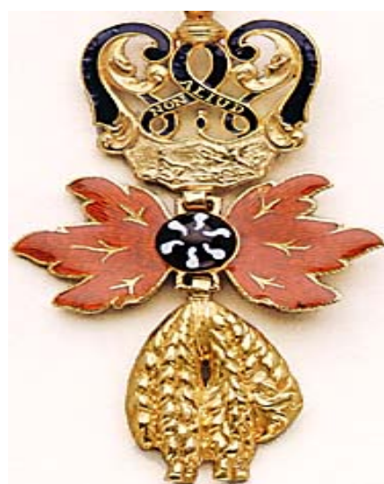
Collari dell'ordine del Toson d'oro