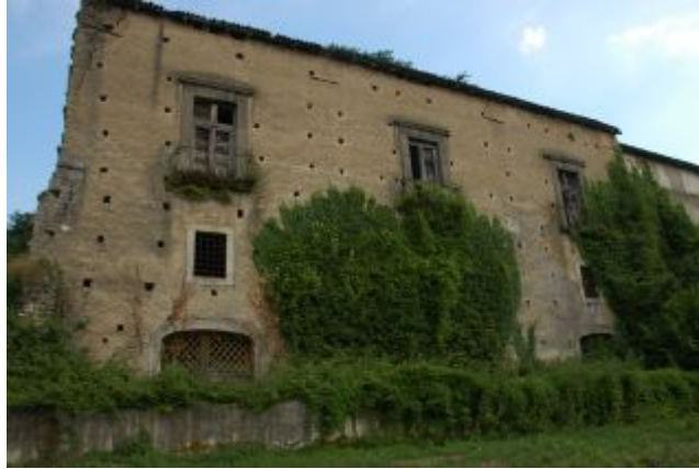
Atripalda Castello Caracciolo

sione spagnola. Il re di Spagna, privo di eredi, aveva designato come successore Filippo V di Borbone, nipote di Luigi XIV, al quale si contrappose Carlo d'Asburgo. A Marino III fu conferita la nomina di viceré dei due Principati, che però non soddisfece la sua ambizione né lo ripagò delle forti spese sostenute per i preparativi militari. Rifiutò allora il sostegno a Filippo V per mettersi a capo del partito austriaco schierandosi a favore dell'arciduca Carlo d'Austria. Al termine della guerra a Filippo V toccò la Spagna e a Carlo III d'Austria (divenuto nel 1711 imperatore col nome di Carlo VI) il regno di Napoli. Il principe Caracciolo ricevette in cambio il titolo di Grande di Spagna di 1 a classe, di Gran Cancelliere del regno e di Cavaliere dell'Ordine del Toson d'oro.