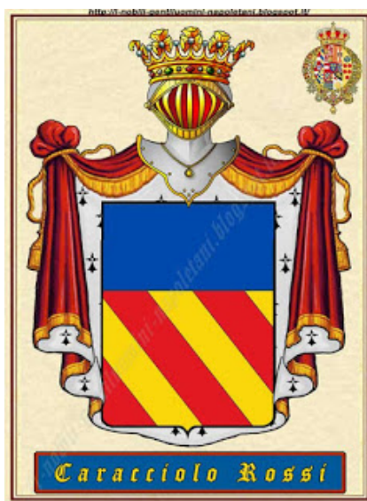
Stemma dei Caracciolo Rossi

Il loro motto fu “Numen regemque salutat” (Saluta Dio e il re) 6 .