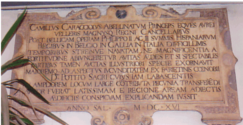
Il palazzo di proprietà della famiglia Rossi acquistato a Napoli da Camillo Caracciolo

L'impulso maggiore alla principale attività economica cittadina fu dato con la sua regolamentazione mediante la concessione nel 1604 di nuovi statuti. Non mancò di interessarsi di opere di carattere sociale e per contrastare l'usura e dare aiuto ai bisognosi, creò con la dote della moglie Roberta Carafa un Monte di Pietà, che era anche un Monte di maritaggio, con cui assegnava la somma di 50 scudi alle fanciulle orfane e povere della città, istituendo anche, con l'approvazione pontificia, un Conservatorio di suore, che si occupassero dell'educazione di fanciulle di buona famiglia. Avviò la costruzione di edifici civili e religiosi e portò a termine i restauri alla chiesa di S. Giovanni Battista, più conosciuta come Monserrato, edificata dalla contessa Maria de Cardona.