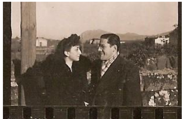
3 febbraio 1946