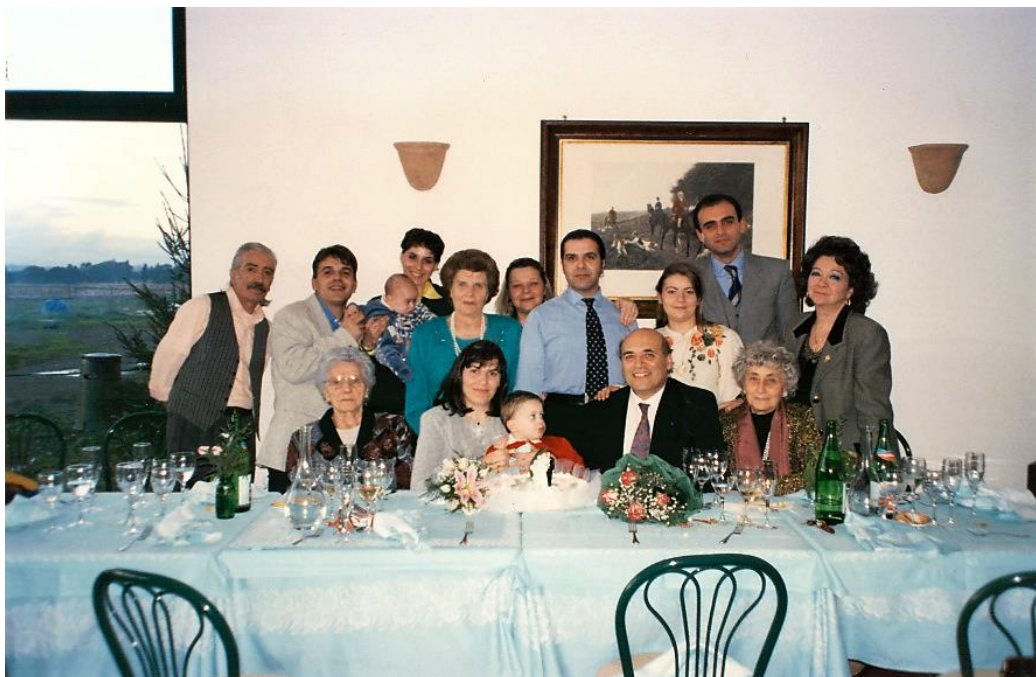
...e al mio “sposalizio bis” a Roma 12 dicembre 1996.

Poi nel corso degli anni qualcuno ci lasciò, ma non per sua volontà. I superstiti di queste innumerevoli storie familiari, in circostanze felici o talvolta drammatiche, si sono sempre ritrovati negli affetti e nei valori, quelli tramandati attraverso successive generazioni .