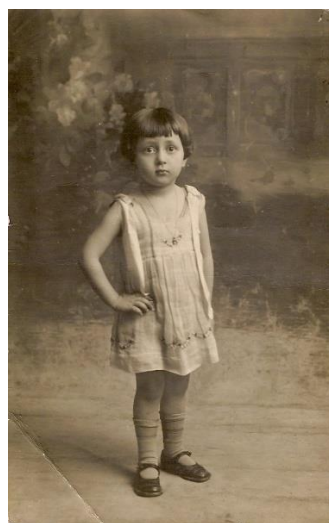
...e a 4 anni.